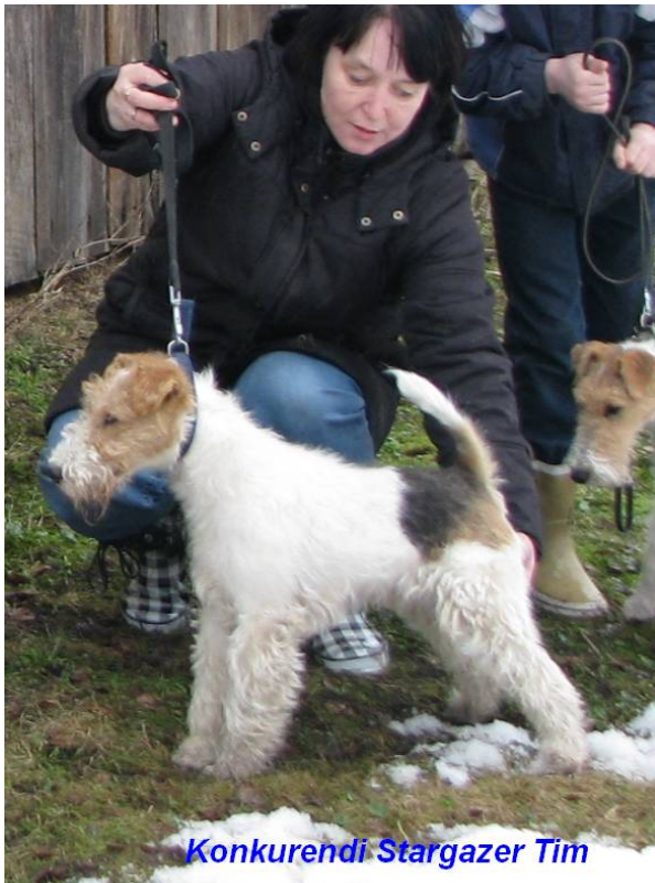
Konkurendi Stargazer Tim