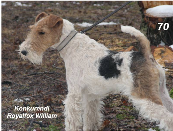
Konkurendi Royalfox William