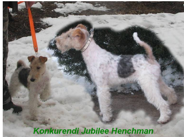
Konkurendi Jubilee Henchman