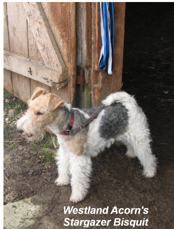
Westland Acorn's Stargazer Bisquit