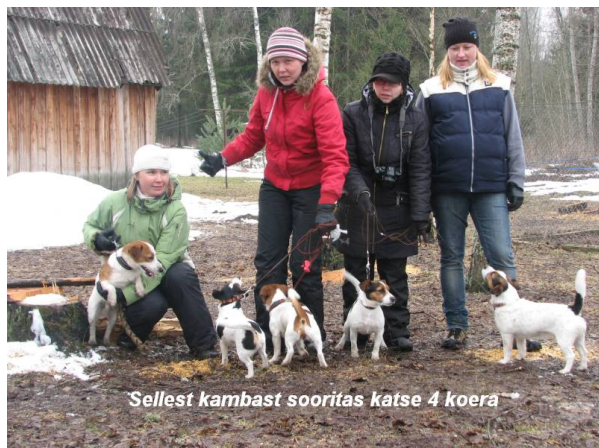
Sellest kambast sooritas katse 4 koera