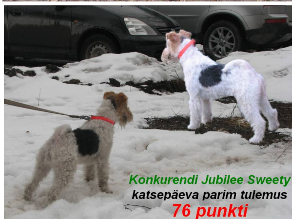
Konkurendi Jubilee Sweety katsepäeva parim tulemus 76 punkti